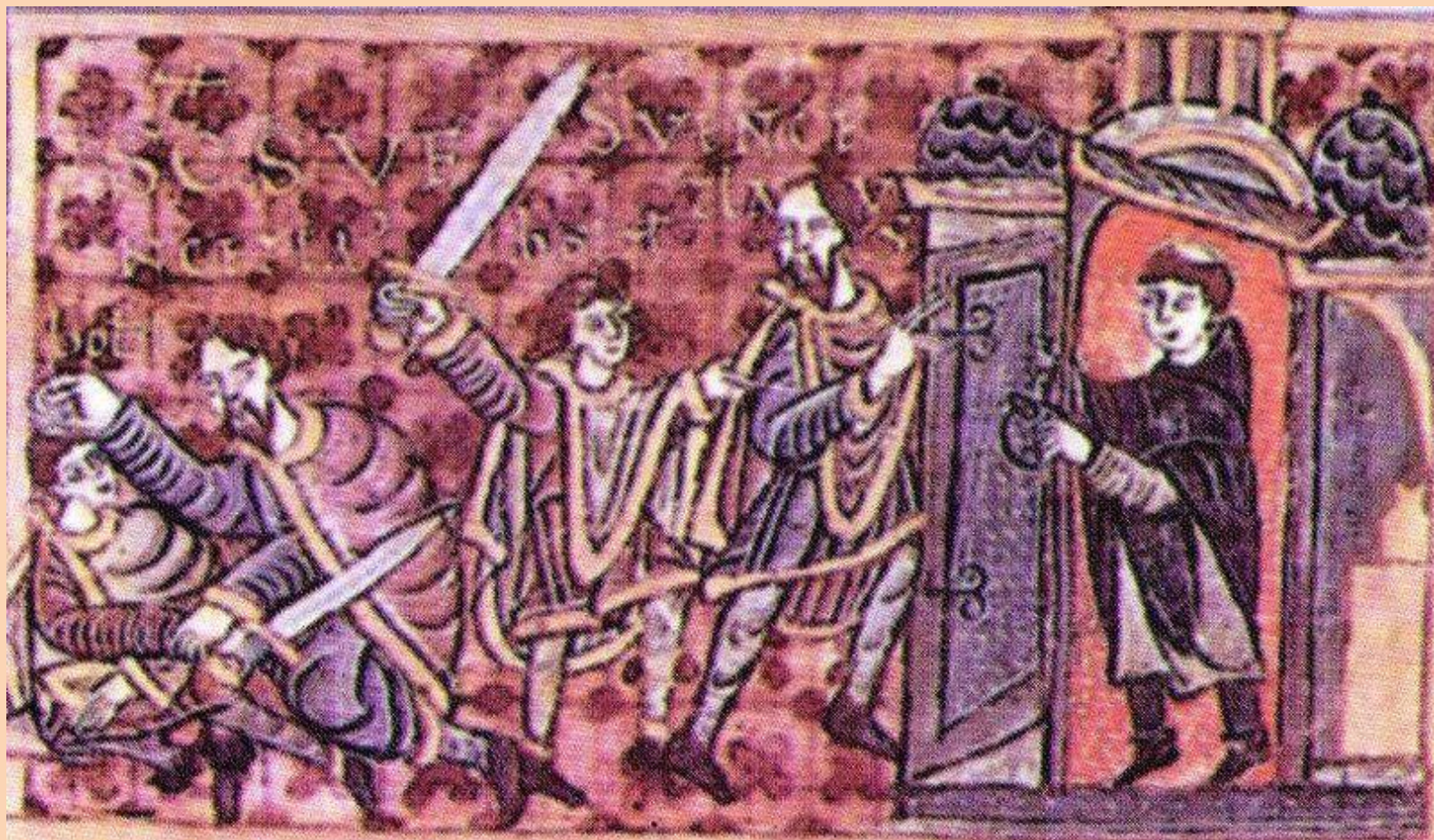
Zavraždění sv. Václava