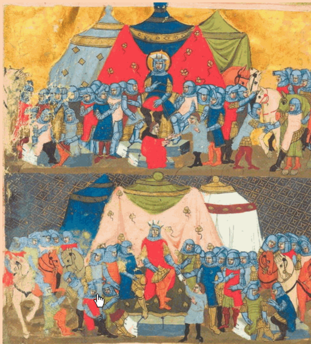
Sv. Václav v konfliktu s jedním ze susedů, Dalimilova kronika