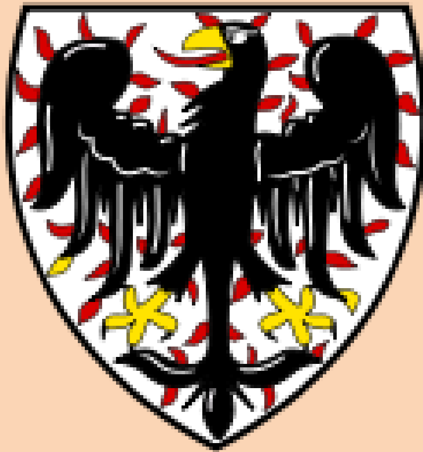
Erb rodu Přemyslovců