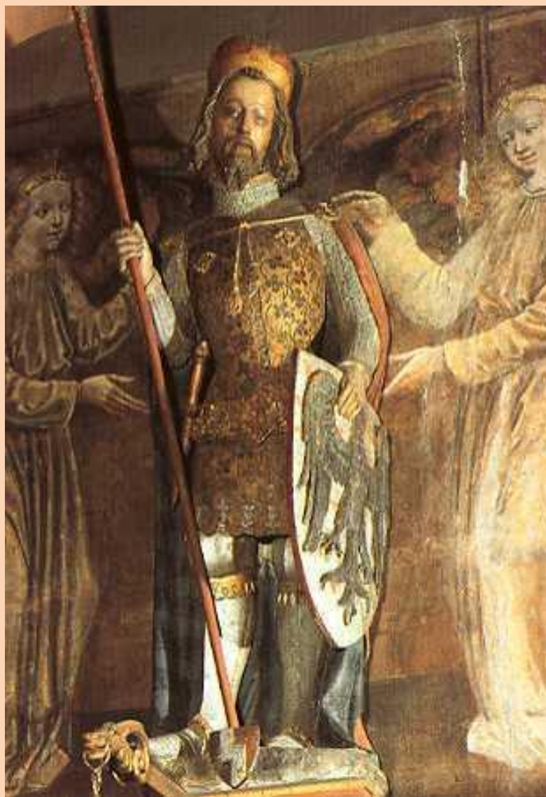
Socha sv. Václava v chrámu sv. Víta